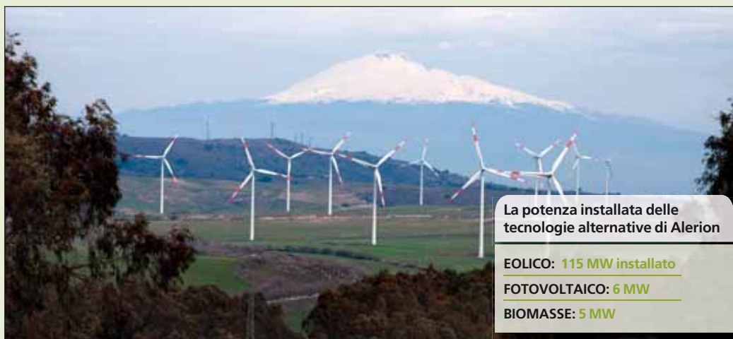
La potenza installata delle tecnologie alternative di Alerion

MW ai quali si aggiungono i MW prodotti con fotovoltaici e qualche operazione mirata nel settore delle biomasse. Ma soprattutto inizia a trarre i vantaggi finanziari come vero e proprio produttore di energia elettrica essendosi trasformata da holding finanziaria legata a Enertad (ora del gruppo Erg ) a vero e proprio gruppo industriale che inizia a guardare anche fuori dai confini nazionali, con la Romania che potrebbe a breve ospitare un impianto eolico. m.c.cer.