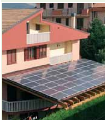
Un impianto fotovoltaico privato realizzato da Sorgenia Solar.