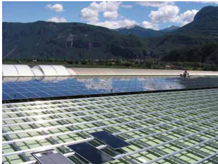
Uno degli impianti realizzati sulla struttura della cooperativa Egma-Kaltern

Il secondo impianto, costituito da 2.808 moduli a film sottile Fs 272, presenta una superficie di installazione a due falde in lamiera grecate, con la medesima inclinazione della precedente struttura, ma esposte, rispettivamente, una a Ovest e l'altra a Sud. Con una potenza di picco pari a 203,6 kWp, la produzione annuale arriverà a 205,5 MWh, con un risparmio di 47,25 tonnellate equivalenti di petrolio e di 109,7 tonnellate di anidride carbonica. «L'impianto, attualmente, copre il 22% dei consumi della cooperativa, la quale pensa, però, di estenderlo in futuro fino a soddisfare il 35% del suo fabbisogno energetico» spiega Alberto Pastore , project manager di Conergy. Come sottolinea Harald Weis , presidente della cooperativa agricola Egma-Kaltern, la scelta di ricorrere all'energia solare per soddisfare i propri fabbisogni energetici è dipesa principalmente da due fattori: la necessità di agire a favore dell'ambiente e l'incentivazione prevista dal Conto energia che rende con-