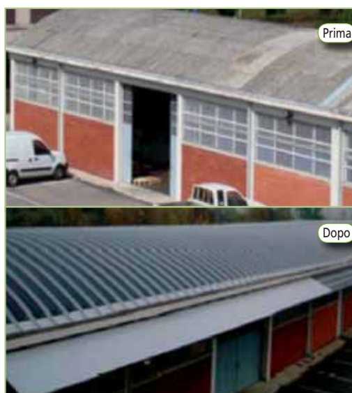
Sui tetti dei capannoni spariscono le coperture in eternit e arrivano i pannelli fotovoltaici

ment prevede di avvalersi di aziende specializzate sia nella rimozione dell'eternit che nella posa della lana di roccia per la coibentazio-