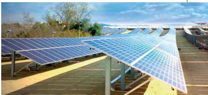
Impianto fotovoltaico di Sorgenia Solar di Vibo Valentia della potenza di 1 MW.

autoconsumo, dell'energia prodotta: un investimento oggi che, piccolo o grande, offre un ventennale di grande interesse .